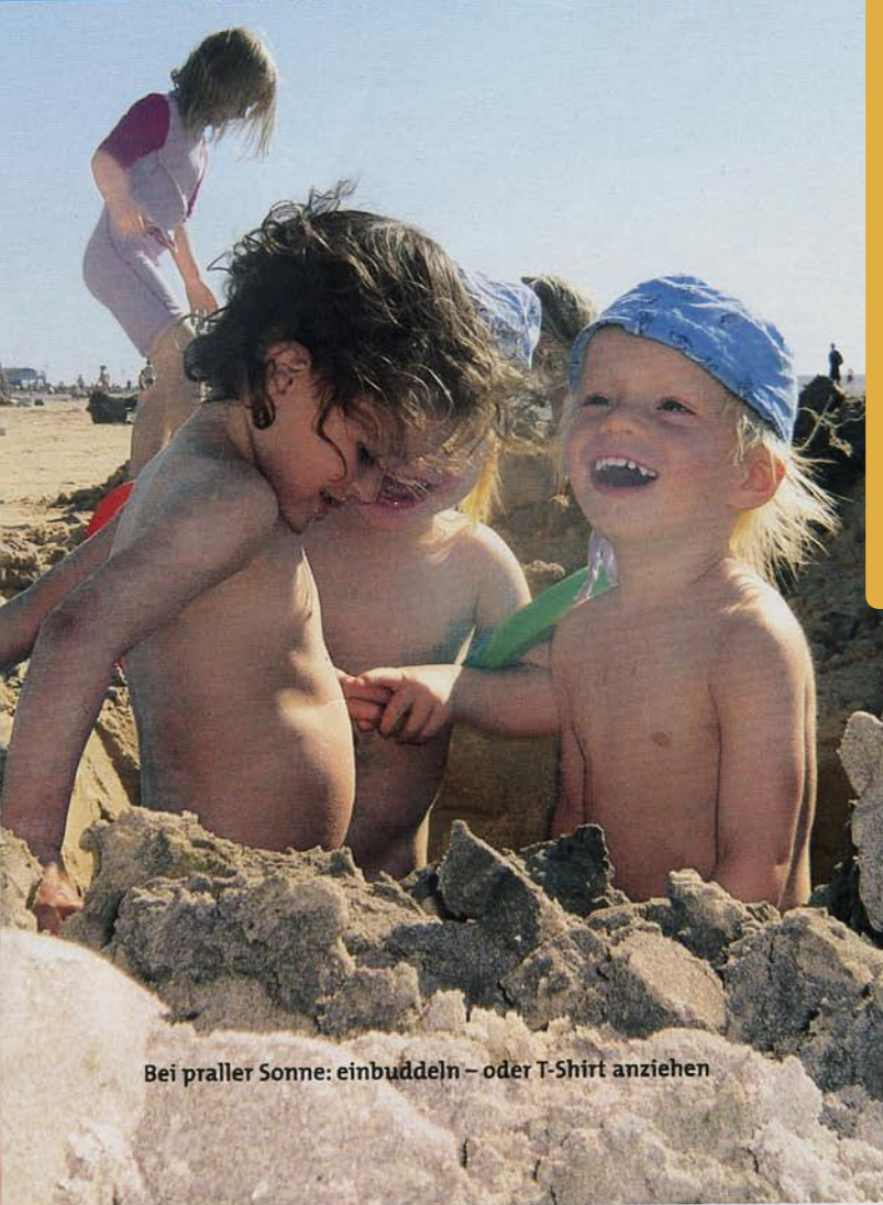
Bei praller Sonne: einbuddeln – oder T-Shirt anziehen